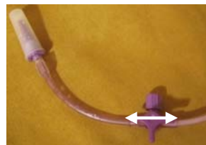
2. Virtaus pumpusta mahan suuntaan auki, lääkkeenantohaara kiinni.