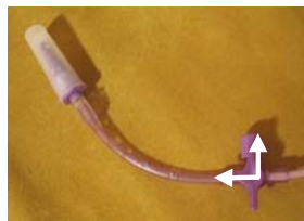
1. Reitti auki lääkkeenantohaarasta mahaan, pumppuun päin kiinni.